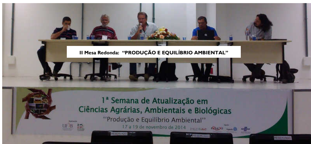
II Mesa Redonda: “PRODUÇÃO E EQUILÍBRIO AMBIENTAL”