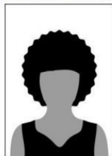
Figura 01 - Modelo de foto frontal