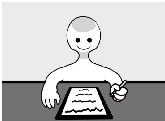
Figura 05 – Enquadramento frontal da câmera.

9.7.4.5. Durante toda a duração da avaliação, a elaboração das respostas deverá ser realizada com a câmera das/os candidatos/as aberta, posicionada em distância e enquadramento suficientes para visualização da/o candidata/o, do seu entorno e da prova, conforme orientação das imagens abaixo: