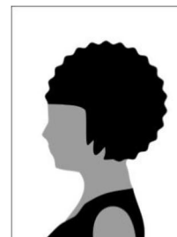
Figura 02 - Modelo de foto de perfil