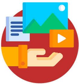
AÇÕES DA GTA