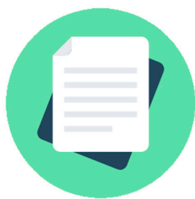
NORMAS E ORIENTAÇÕES