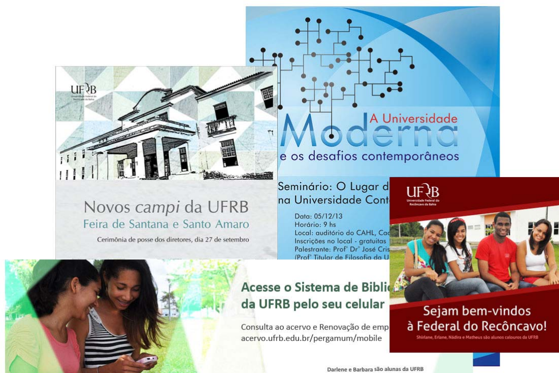
Figura 2 – Alguns trabalhos realizados pelo Núcleo de Design e Propaganda