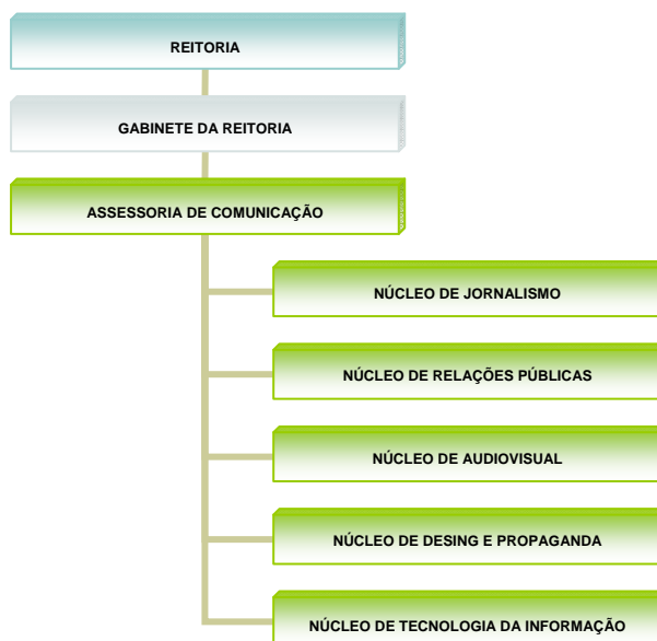
Figura 1 – Organograma da ASCOM