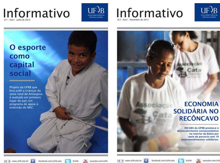
Figura 5 – Edições do Informativo UFRB

Não obstante os avanços na estruturação da ASCOM e reconhecimento pelos seus serviços, ainda podemos apontar alguns problemas que demandam soluções urgentes e que precisam ser priorizadas em 2014, uma vez que a gradual consolidação traz consigo novos desafios. Destacamos que os fatores limitantes principais para uma melhor atuação da Unidade são: a) falta de pessoal; b) espaço físico insuficiente; c) pouca colaboração das demais Unidades e; d) inexistência de recursos específicos.