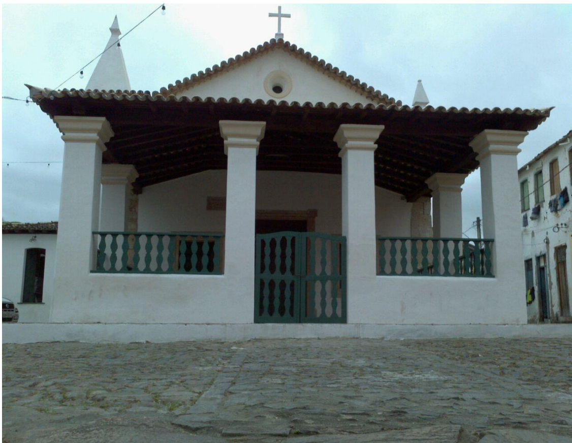
Figura 13: Capela de Nossa Senhora da D'Ajuda – Cachoeira -BA