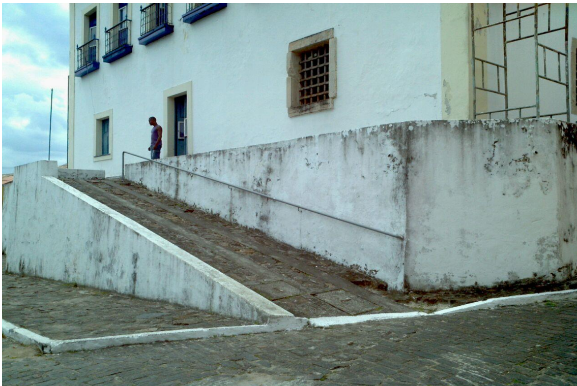
Figura 6: Paço Municipal (Casa de Câmara e Cadeia) – Cachoeira –BA