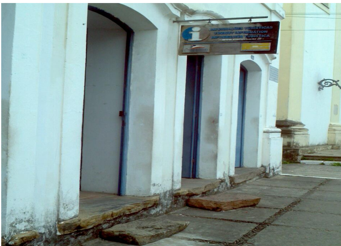
Figura 10: Centro de Informações de Turismo – Cachoeira –BA