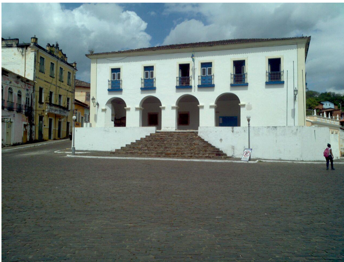
Figura 5: Paço Municipal (Casa de Câmara e Cadeia) - BA