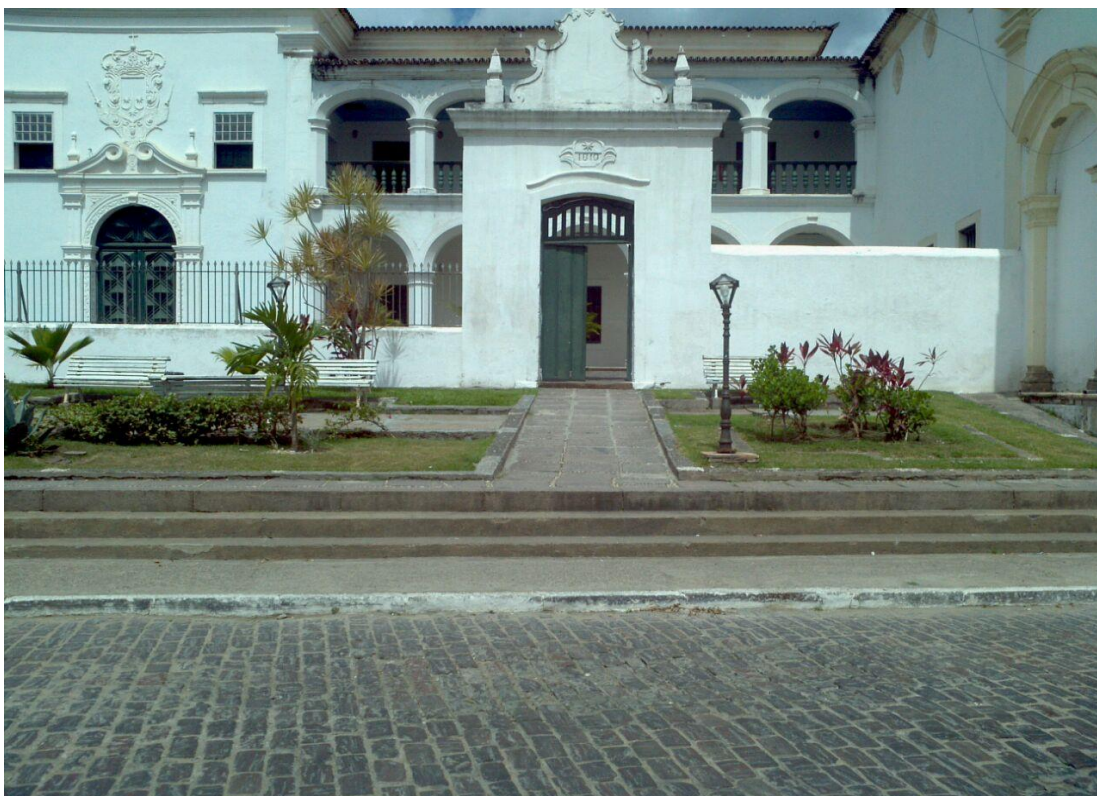
Figura 8: Conjunto do Carmo - Ordem Primeira – Igreja) – Cachoeira - BA