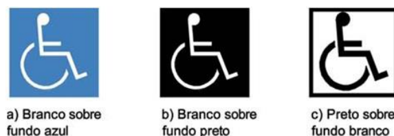
Figura 2: Símbolo Internacional de Acesso