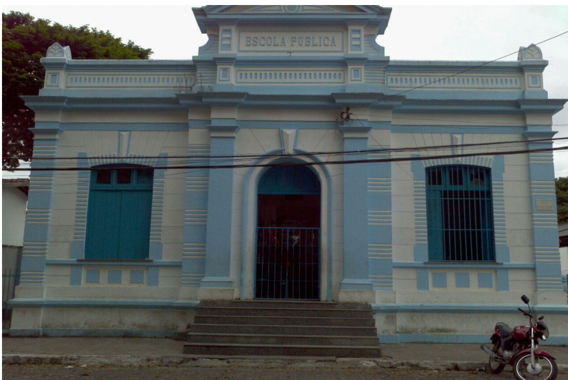
Figura 12: Escola Municipal Ana Néry – Cachoeira –BA