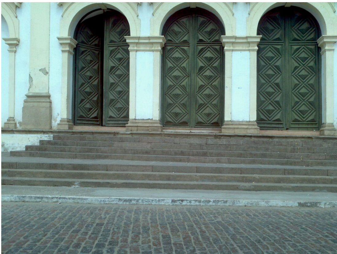
Figura 7: Conjunto do Carmo - Ordem Terceira (Centro de Convenções) – Cachoeira -BA