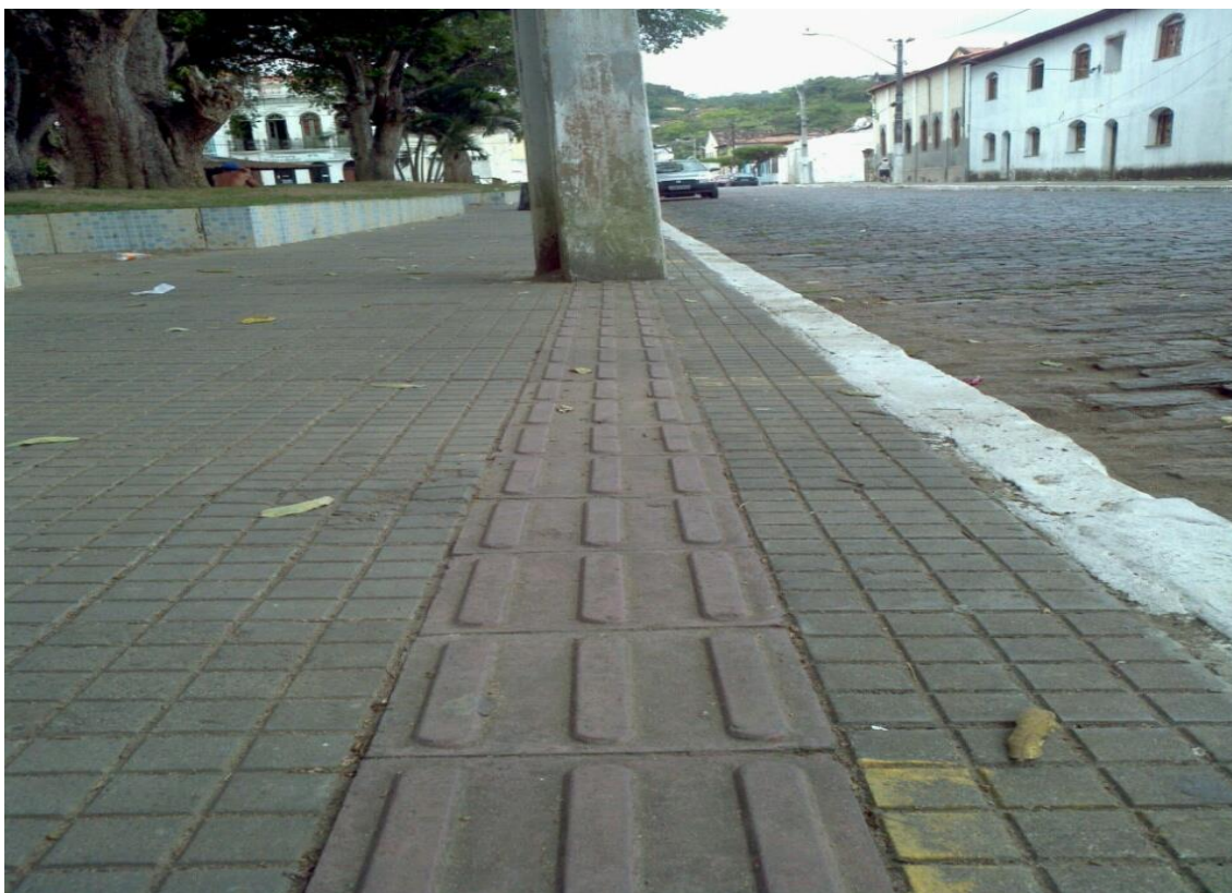
Figura 11: Passeio com Piso Tático – Cachoeira -BA