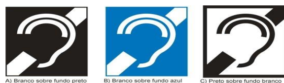
Figura 4: Símbolo Internacional da Pessoa com Deficiência Auditiva – Fonte: NBR 9050

Essas simbologias devem ser usadas para especificar os locais em que se torna obrigatório à colocação do símbolo. Eles irão especificar vagas em locais públicos, a existência de equipamentos, mobiliários ou qualquer outra situação diversa para pessoas com deficiência física incluindo as pessoas com deficiência visual e auditiva. Com a ausência desses instrumentos como condições mínimas de acesso, torna-se inviável garantir os direitos de acessibilidade nos espaços físicos e equipamentos urbanos para esse público.