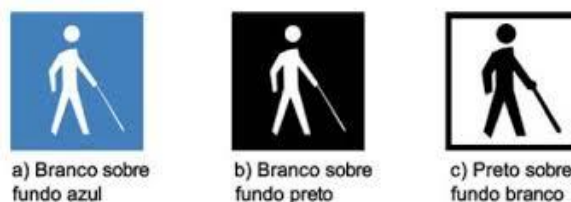
Figura 3: Símbolo Internacional da Pessoa com Deficiência Visual