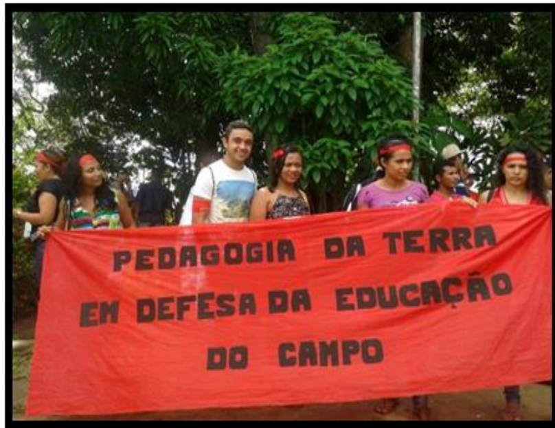
Figura 9 - Movimento de reivindicação no INCRA-MA para liberação de recurso