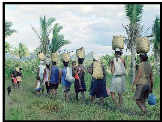
Figura 3 - Mulheres quebradeiras de coco babaçu

Fonte: https://nossomaranhao.files.wordpress.com (2010).