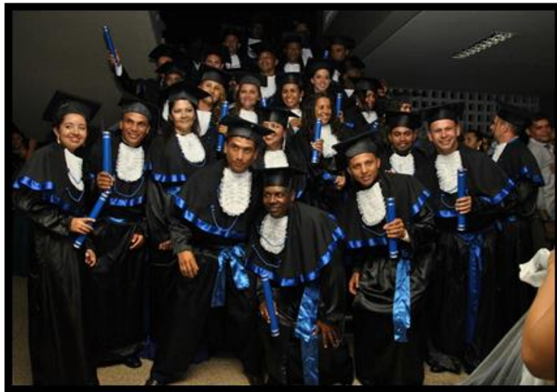
Figura 10 - Formatura 1º Turma Pedagogia da Terra/PRONERA-UFMA