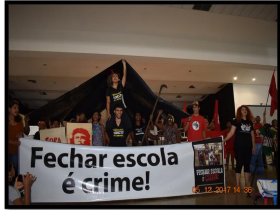
Figura 5 - VII Seminário das Ledocs