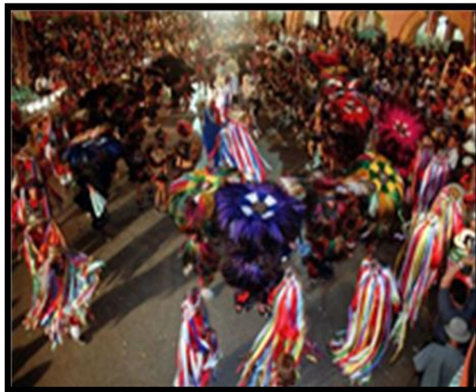
Figura 7 - Festa do Bumba-meu-boi