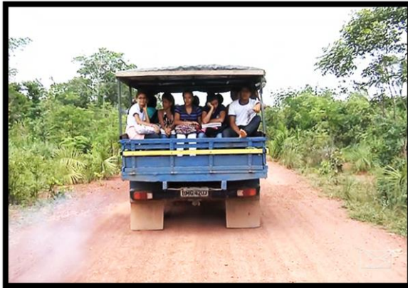
Figura 2 - Transporte de alunos para cidade