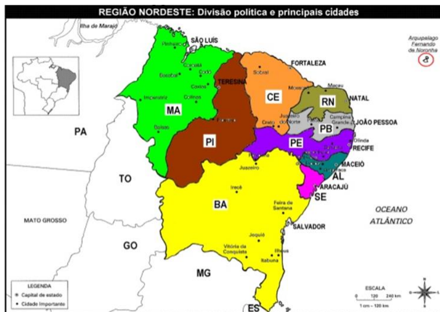
Figura 1 - Região Nordeste/Maranhão