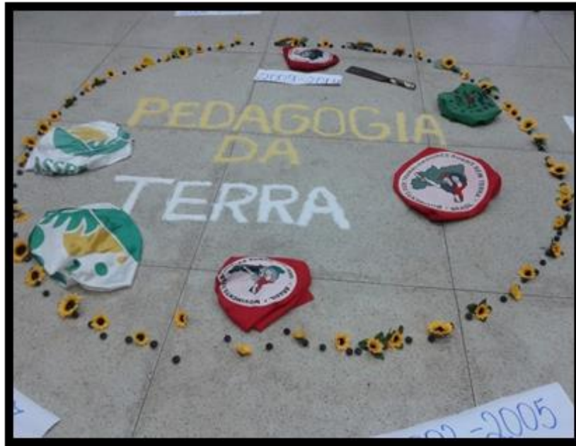
Figura 8 - Mística no curso Pedagogia da Terra – UFMA/MST/ASSEMA