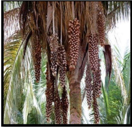
Figura 4 - Palmeira de babaçu