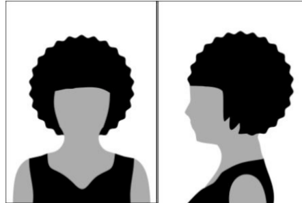
Figura 01 - Modelo de foto frontal