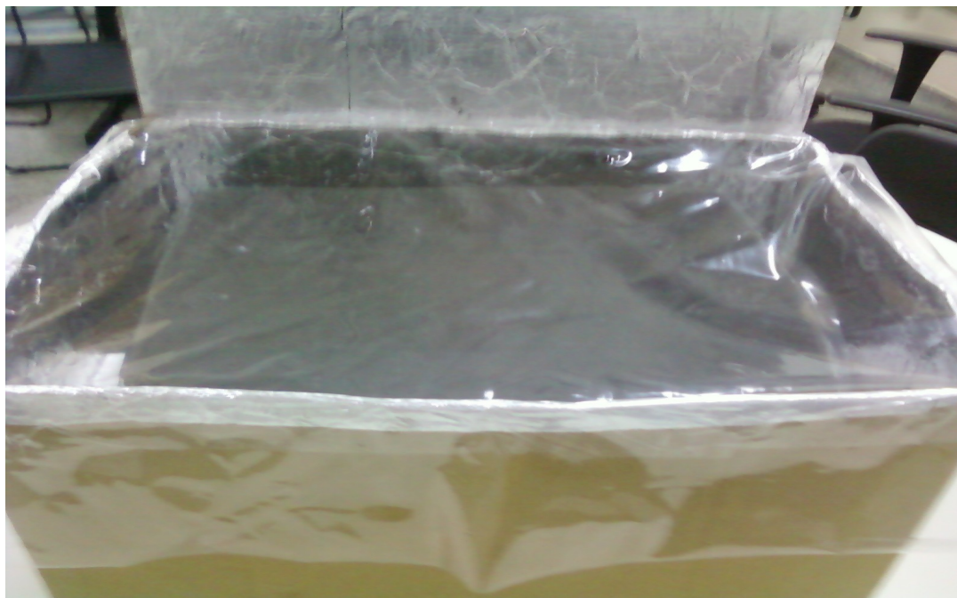
Tampa de plástico para as caixas. Fonte: autores.

Utilize o plástico transparente como tampa, tanto na caixa interna quanto na caixa externa.