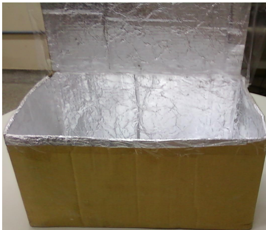
Caixa exterior revestida com papel-alumínio.

Revista a caixa maior (ou externa) com papel-alumínio. Utilize outro pedaço de papelão para servir de tampa para a caixa e também a revista com papel-alumínio. A tampa servirá para direcionar a luz solar para o interior da caixa (figura abaixo).