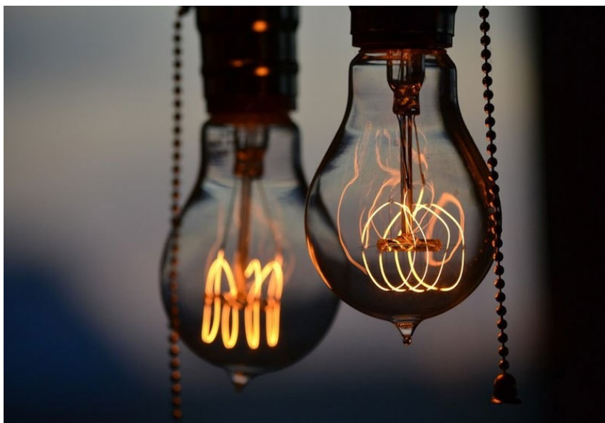
Filamento das lâmpadas.

Em um dia ensolarado, é comum procurarmos abrigos à sombra contra a intensa luz solar. A radiação é suficiente para bronzear a pele, ou mesmo causar sérios danos se não for utilizado protetor solar. Este é um exemplo prático da transmissão do calor por irradiação, cuja propagação se dá através das ondas eletromagnéticas. Todo corpo emite radiação. Além disso, é possível estabelecer uma relação entre a radiação emitida por um corpo e sua temperatura. Tal relação é conhecida como Lei de Wien . Um corpo a uma alta temperatura irá emitir radiação na região da luz visível. Esse é o caso dos metais. As lâmpadas incandescentes, por exemplo, possuem um filamento composto de Tungstênio que pode chegar a temperaturas superiores aos 3.000 ° C!