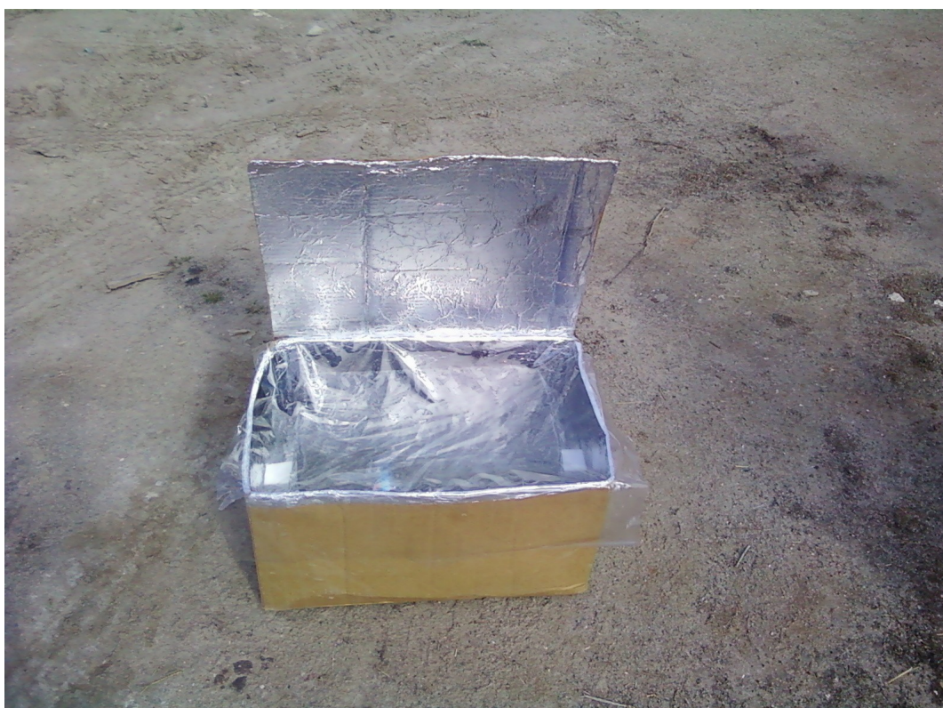
Forno solar em “funcionamento”.

Leve seu forno solar para um local aberto em um dia ensolarado. Coloque um termômetro no interior da caixa menor e outro no interior da caixa maior. Ou se preferir, coloque uma panela contendo arroz e água no interior da caixa menor. Aguarde cerca de 40 minutos.