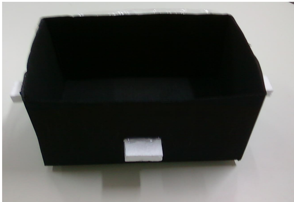
Caixa interior.

Pinte toda a caixa menor (ou interna) com a tinta preta, conforme a figura abaixo. Utilize o isopor para fazer pequenas placas que deverão ser coladas na lateral da caixa, de modo que impeçam a movimentação da caixa menor quando for colocada no interior da caixa maior.