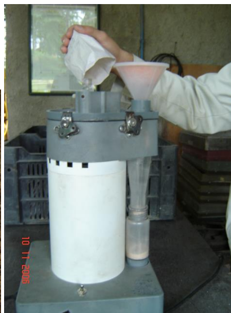
Figura 4: Moinho Willey

Após 24h de armazenamento, a madeira moída foi compactada manualmente na unidade de leitura do espectrofotômetro ( spinning ), e assim, foram coletados os espectros NIR de cada amostra, em duplicata. A leitura dos espectros foi feita em um equipamento NirSystem 5000 da Foss (acoplado ao software WinISI) (Figura 5), composto por uma fonte luminosa, um monocromador, com seletor de comprimentos de onda do tipo de grupos funcionais orgânicos, uma rede de difração, um receptáculo para amostras, um fotodetector e um computador, onde são armazenados os espectros (Figura 6). De acordo com Nisgoski (2005), o aparelho faz 32 varreduras por leitura e o espectrofotômetro envia o valor médio de \log(1/R) para o computador, gerando assim um espectro.