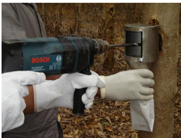
Figura 3: Remoção das baguetas