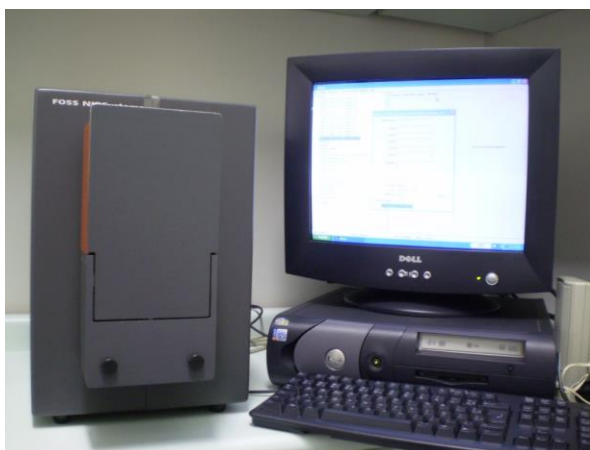
Figura 2: Leitura no espectrofotometro NIR

O rendimento depurado de cada árvore do experimento foi estimado com utilização do NIR, realizado no Laboratório de Melhoramento Genético Florestal da Universidade Federal de Lavras - MG.