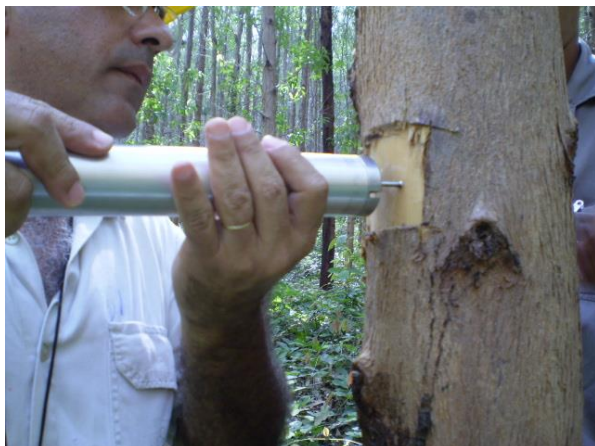
Figura 1: Mensuração da densidade básica