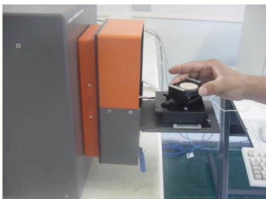
Figura 5: Leitura da amostra no NIR

Após 24h de armazenamento, a madeira moída foi compactada manualmente na unidade de leitura do espectrofotômetro ( spinning ), e assim, foram coletados os espectros NIR de cada amostra, em duplicata. A leitura dos espectros foi feita em um equipamento NirSystem 5000 da Foss (acoplado ao software WinISI) (Figura 5), composto por uma fonte luminosa, um monocromador, com seletor de comprimentos de onda do tipo de grupos funcionais orgânicos, uma rede de difração, um receptáculo para amostras, um fotodetector e um computador, onde são armazenados os espectros (Figura 6). De acordo com Nisgoski (2005), o aparelho faz 32 varreduras por leitura e o espectrofotômetro envia o valor médio de \log(1/R) para o computador, gerando assim um espectro.