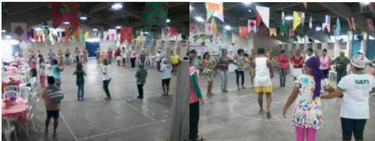
Figura VI – Ensaio do Grupo Formal para a apresentação de São João