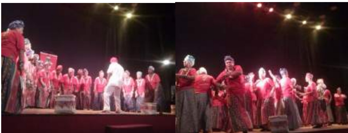
Figura X – Apresentação no CUCA

Ao chegarem de Fortaleza era o momento de se preparar para a apresentação de fim de ano no CUCA. O professor aproveitou a apresentação em Fortaleza para ajustar alguns equívocos acontecidos. Foram muitos ensaios até que tudo se ajeitasse; a quantidade de participantes agora era maior, uma vez que nem todas tiveram dinheiro para fazer a viagem a Fortaleza, mas a apresentação foi um sucesso.