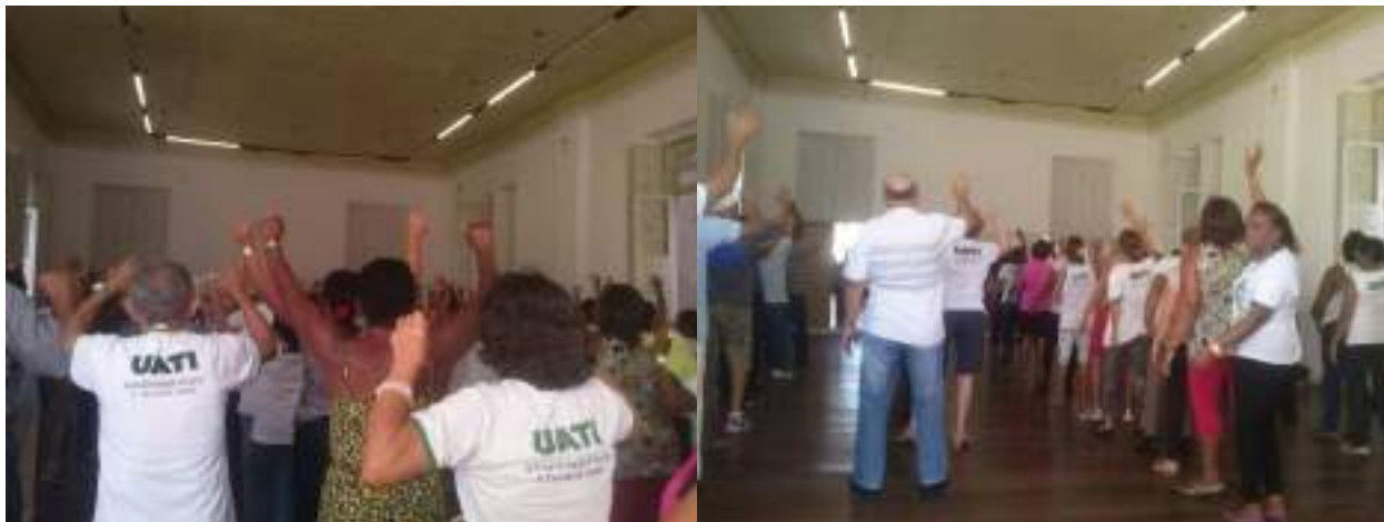
Figura V – Aula do Grupo Informal

ensinava o primeiro passo e todas repetiam. Enquanto todas estavam executando o passo ensinado pelo professor, ele saía circulando no meio do salão para auxiliar àquelas que não estavam conseguindo realizar de maneira correta. Depois de supervisionar um a um, o professor começa então a separar em grupos, segundo a facilidade de reprodução do passo de dança por cada pessoa. Assim o grupo da frente é o que tem maior facilidade e harmonia também. Os grupos do fundo são de pessoas que realmente não estão conseguindo reproduzir o passo. É importante atentar que esses grupos não são fixos e que a formação deles dependerá da facilidade/dificuldade no passo executado a cada semana, portanto, uma pessoa que em uma semana teve dificuldade para aprender um passo, na outra não necessariamente o terá.