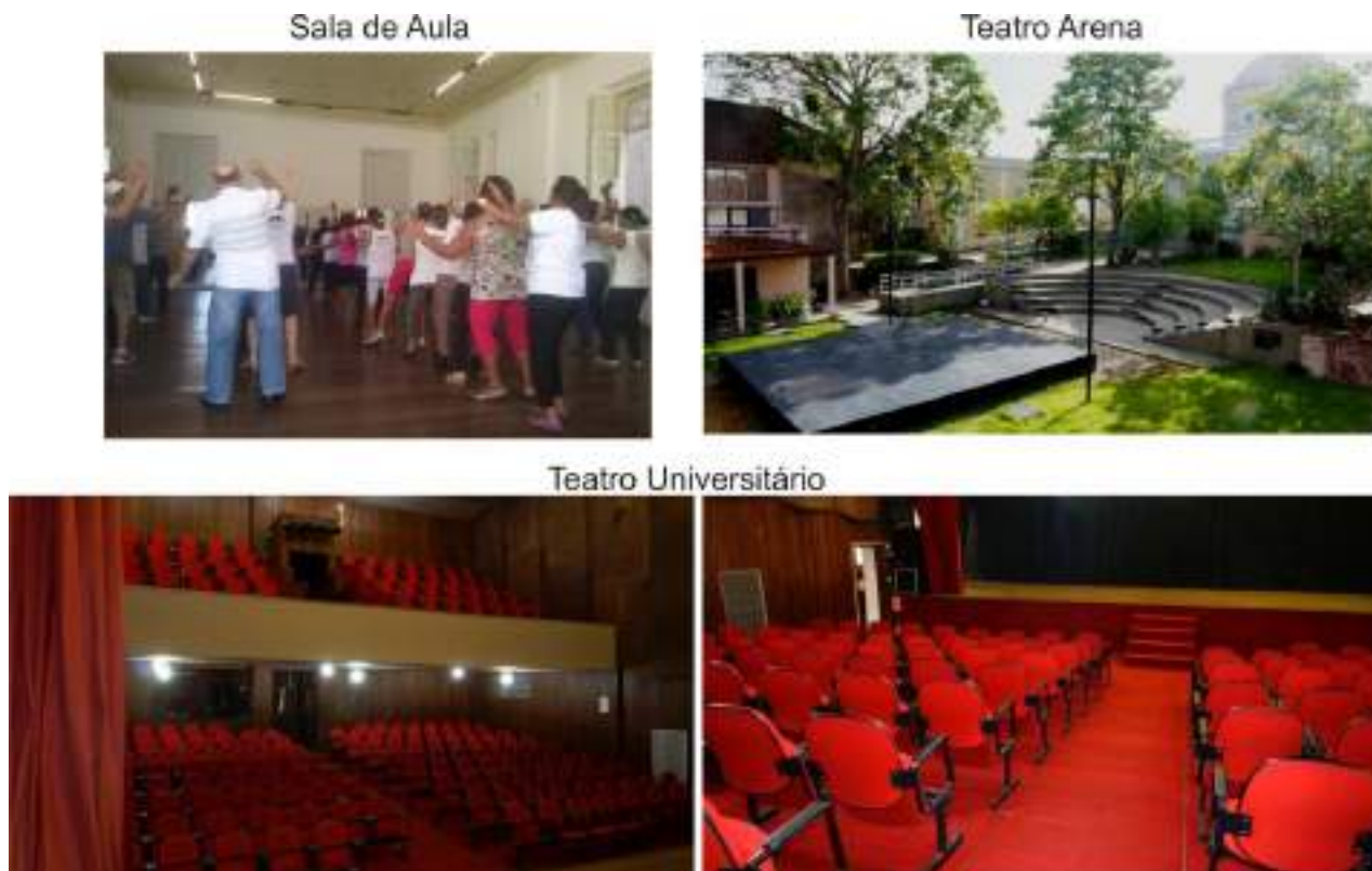
Figura IV– CUCA: Estrutura