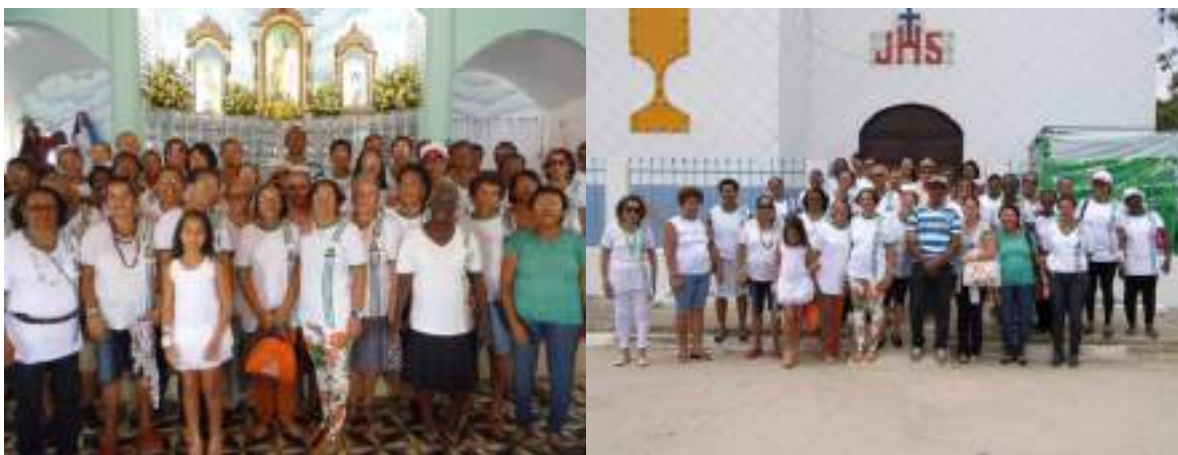
Figura VIII – Missa em Mercês

Ao chegar a Mercês, o padre já nos esperava para a celebração da missa; esse foi um momento de grande emoção, especialmente para o professor e sua família, também foi um momento de muitos agradecimentos.