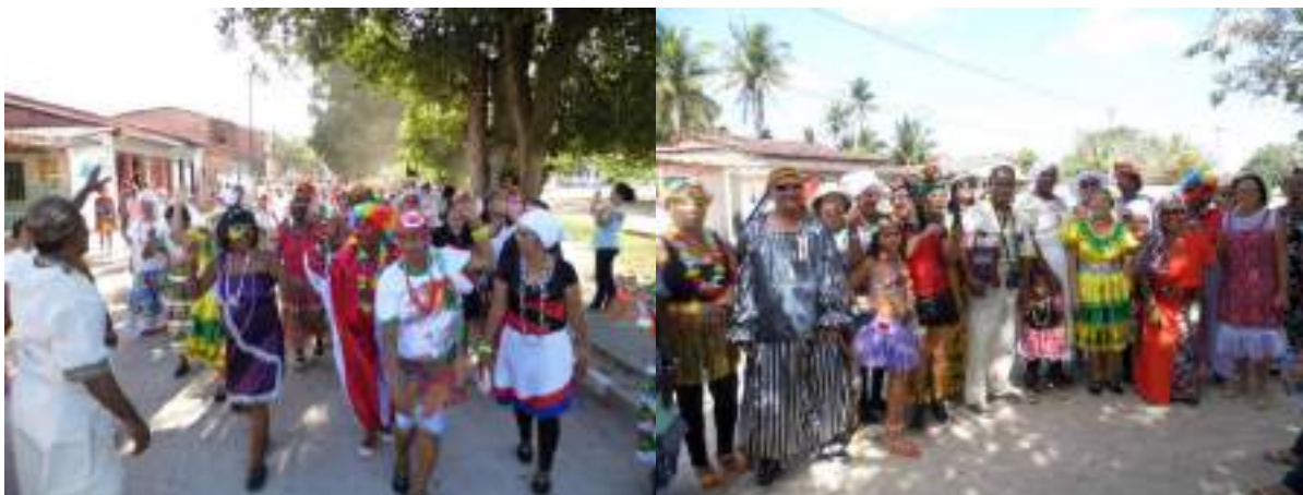
Figura IX – Lavagem em Mercês