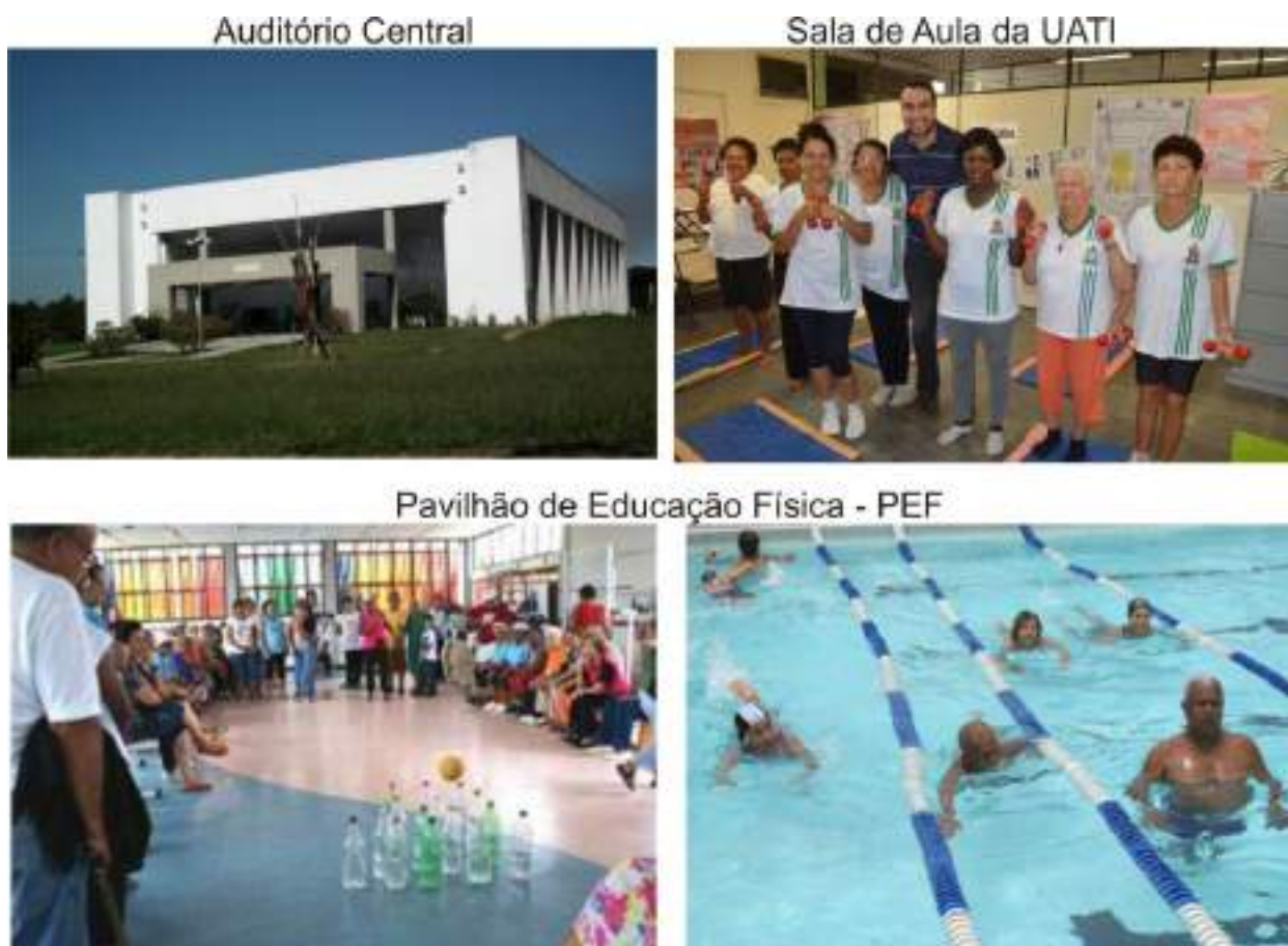
Figura III– UEFS: Estrutura