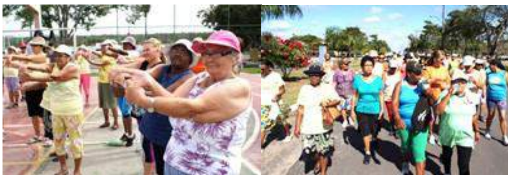
FIGURA I - Jogos Olímpicos da Terceira Idade da UATI/UEFS – Edições Anteriores

natação e uma marcha atlética (embora não possa precisar exatamente a quantidade de metros percorridos). As disputas ocorriam ao mesmo tempo e em diversos lugares do PEF, fato que dificultava bastante a minha observação diante do tamanho do ambiente e da quantidade de pessoas que ali se encontravam, não só das idosas, de familiares, público, professoras, inclusive a imprensa local 5 .