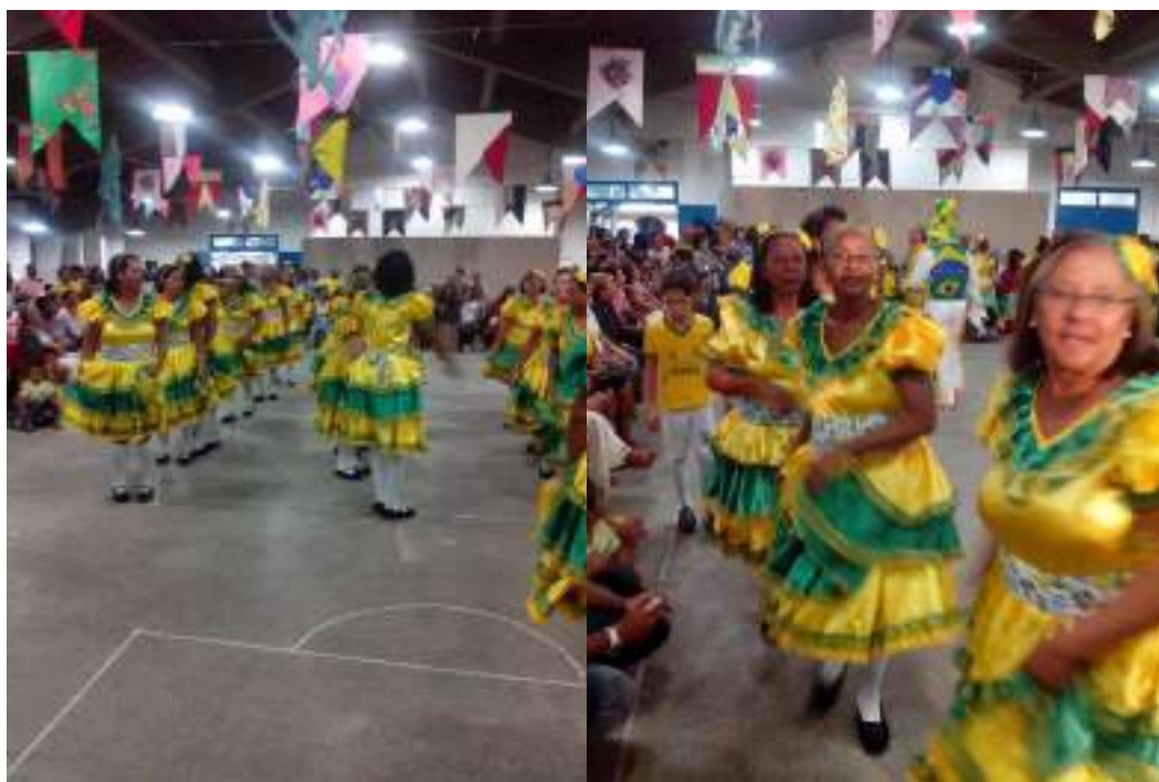
Figura VII– Apresentação da Quadrilha de São João

No dia da apresentação, que aconteceu no CSU (Centro Social Urbano), onde a UATI tem parceria com grupo de convivência de idosos denominado Alegria de Viver, houve um ensaio geral antes da apresentação. Estava tudo perfeito, o lugar estava repleto de familiares e amigos das participantes da UATI, a apresentação foi linda, conforme o ensaiado, todas ficaram satisfeitas com o desempenho que tiveram.