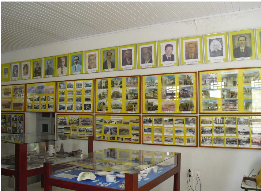
Figura 4 Exposição das Fotografias e Acervo Arqueológico