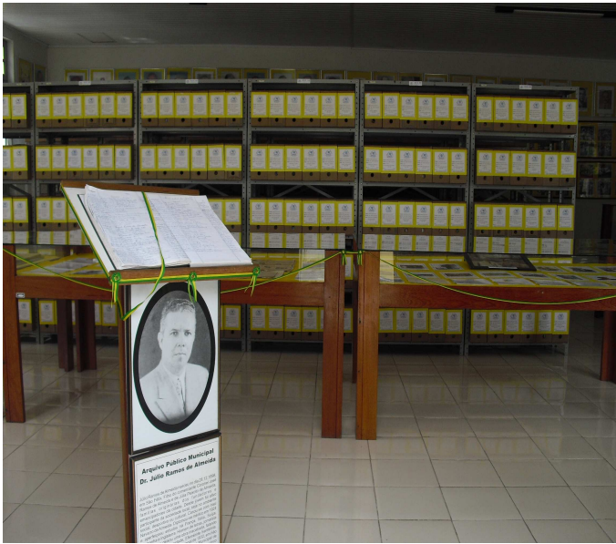
Figura 3 Livro de Registro