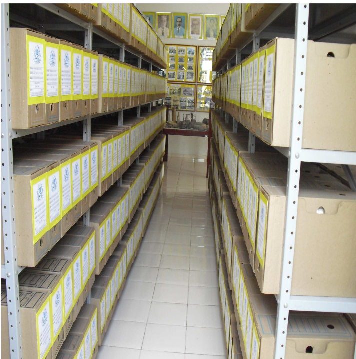
Figura 2 Exposição dos documentos, acervo histórico e fotográfico.

Em seu acervo o Arquivo possui documentações do Executivo, Legislativo e do Judiciário, além de um grande acervo histórico não apenas da cidade de São Félix como da Bahia e do Brasil: documentos sobre os escravos, notas de escrituras/compra e venda de terras e de escravos, doações de imóveis, atas, certidões de óbitos, certidões de casamento, certidões de nascimento, fotografias, retratos dos gestores de São Félix. Além de todo acervo elencado (QUADRO 1 - QUADRO 2), a Instituição tem sobre sua guarda: uma Máquina Olivetti industrial séc. XIX (máquina de datilografar); parte de Extintor de Saúva Séc. XIX; mapa de São Félix; e um rico acervo arqueológico encontrado durante a escavação para a construção da Represa Pedra do Cavalo.