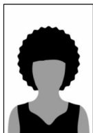
Figura 01 - Modelo de foto frontal