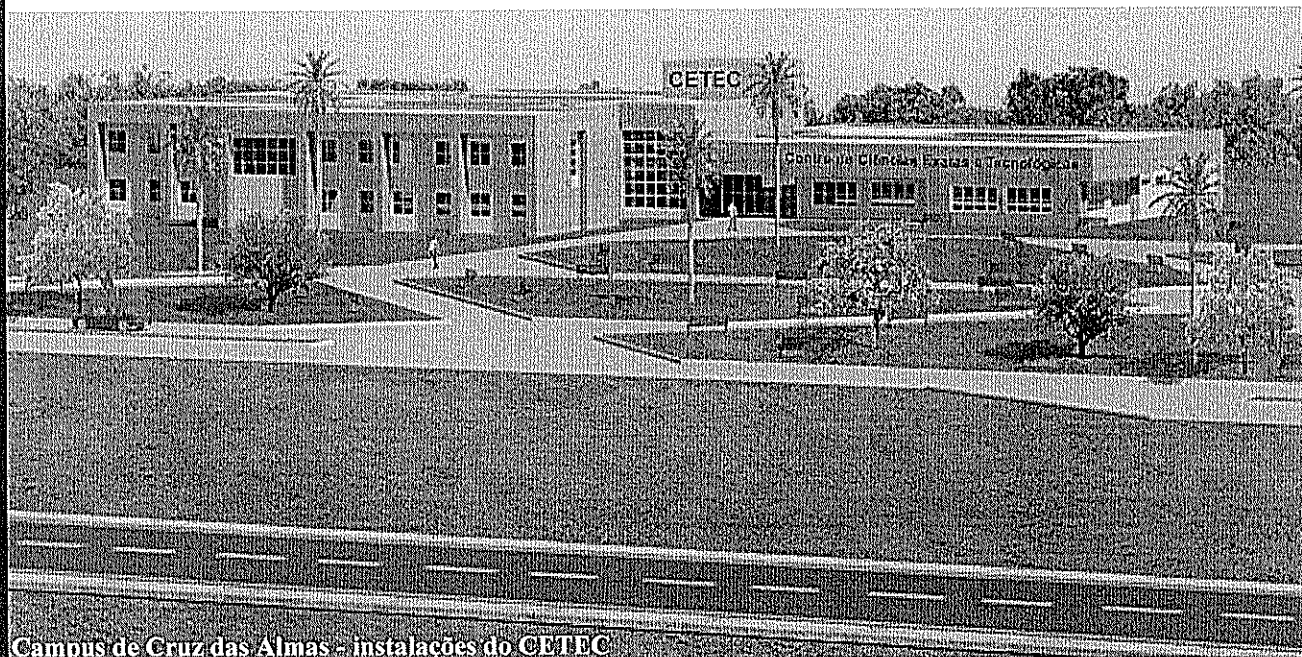
Campus de Cruz das Almas - instalações do CETEC