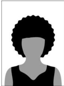
Figura 01 - Modelo de foto frontal