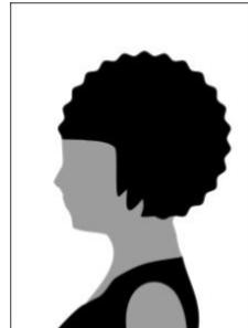
Figura 02 - Modelo de foto de perfil

III - 01 vídeo, que deverá ser gravado e postado no sistema SIGAA no momento da inscrição do(a) candidato(a) no processo seletivo e que deverá obedecer às seguintes especificações: