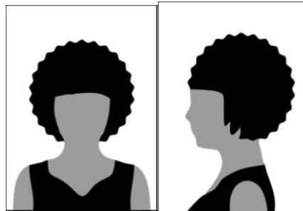
Figura 01 - Modelo de foto frontal