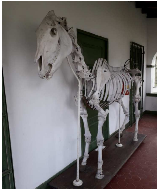
Visita ao laboratório de ZOOTECNIA, para um abraço no PANGARÉ (insônia de “calouro enfeitado”, isto é, dos alunos do segundo ano de Agronomia).