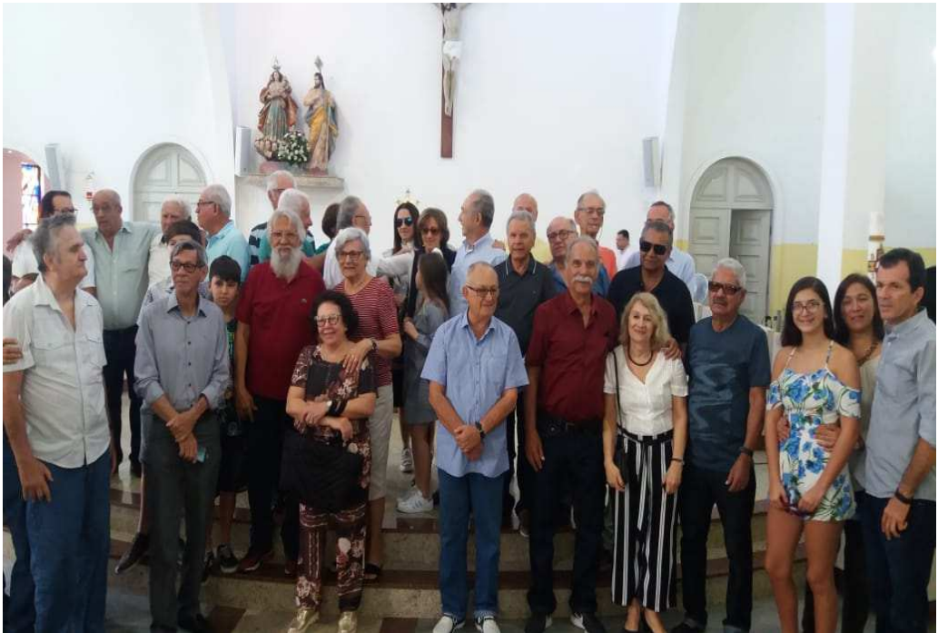
Missa na Catedral local, Nossa Senhora do Bom Sucesso.