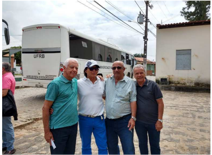
Visita à SAPUCAIA e a sua comunidade hospitaleira